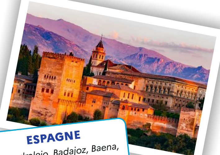
ESPAGNE Almendralejo, Badajoz, Baena, Barcelona, Denia, Granada, Orihuela, Santa Fe, Sevilla, Viladecans, Zaragoza