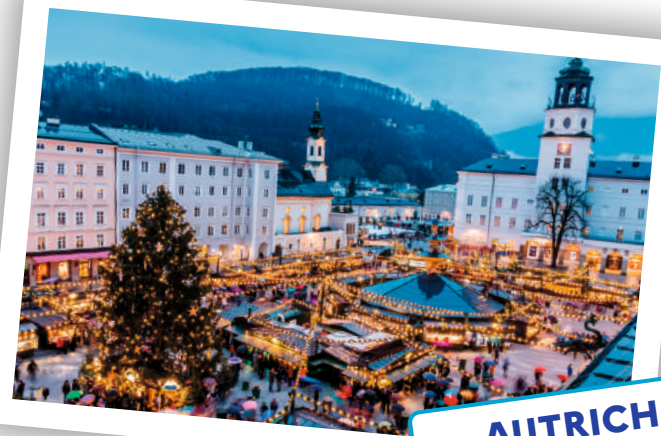
AUTRICHE Feldkirch, Graz